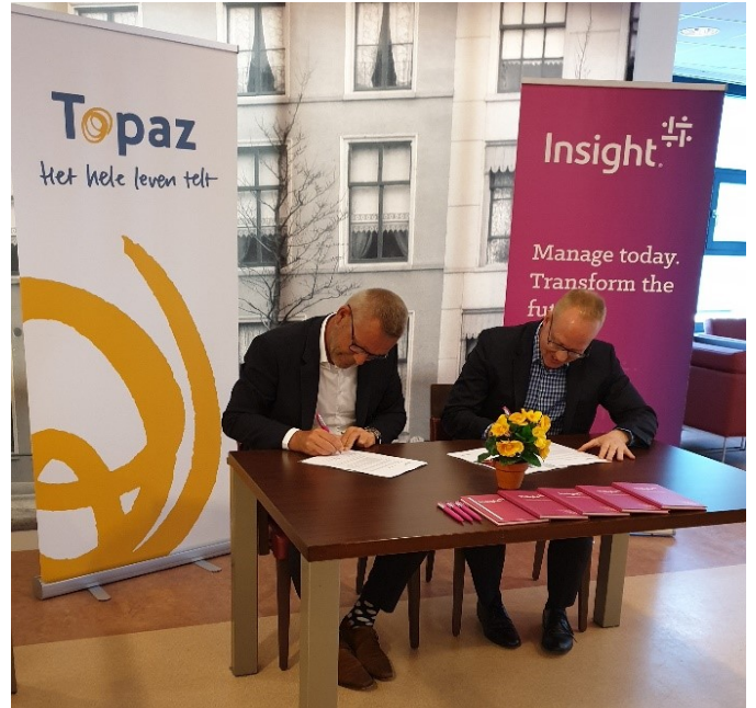
Topaz en Insight bekrachtigen de samenwerking