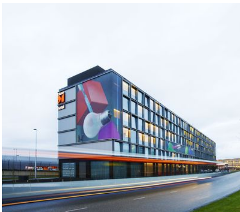
CitizenM, Schiphol Airport, Amsterdam